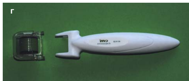
Рис. 1. Внешний вид дермароллеров (а–г)